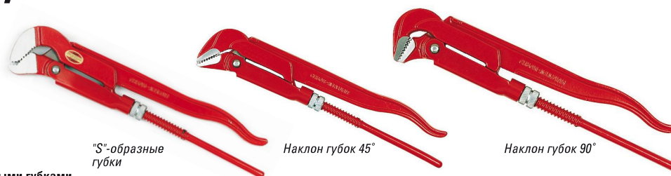
Модель с "S"-образными губками