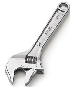
Разводной водопроводный ключ с широким зевом